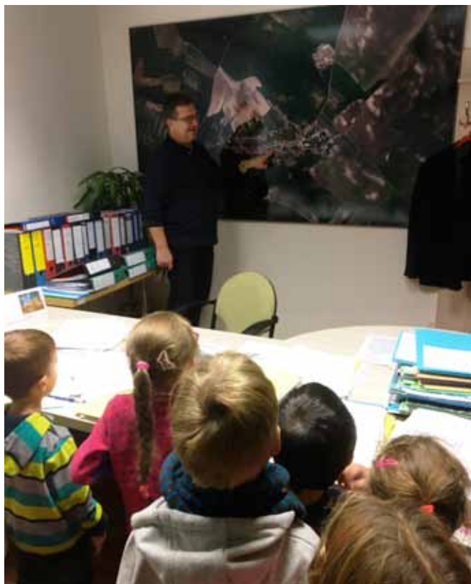
Prohlídka Obecního úřadu