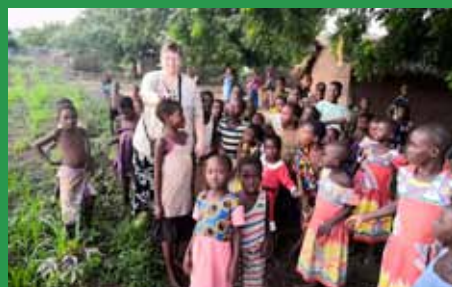
Beseda "O sirotcích"