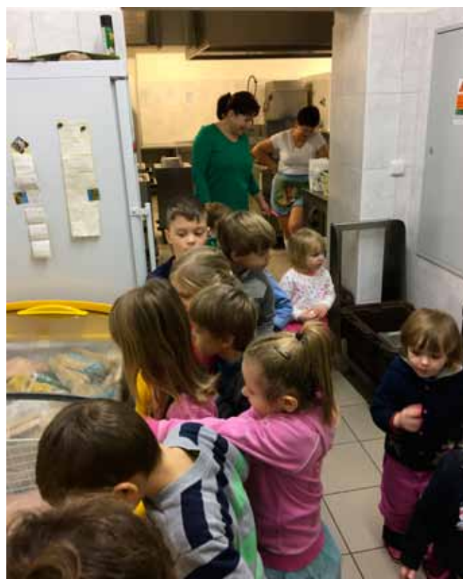
prohlídka kuchyně ZŠ a MŠ