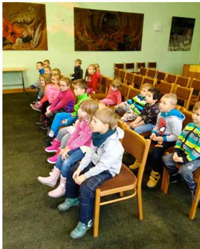
Prohlídka Obecního úřadu