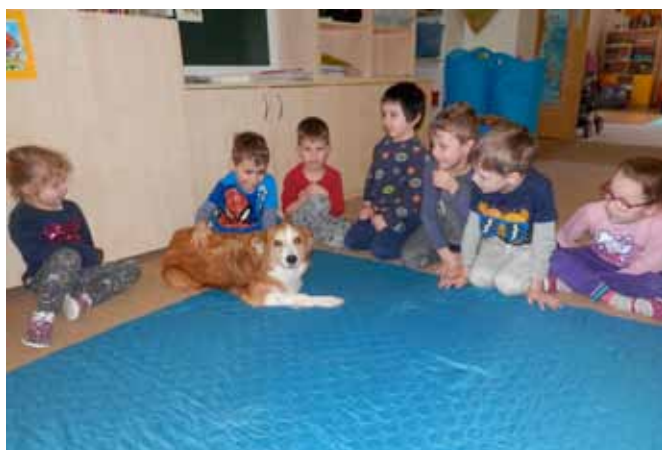
Canisterapie v MŠ

Letošní školní rok 2019/2020 se chýlí ke konci a nás