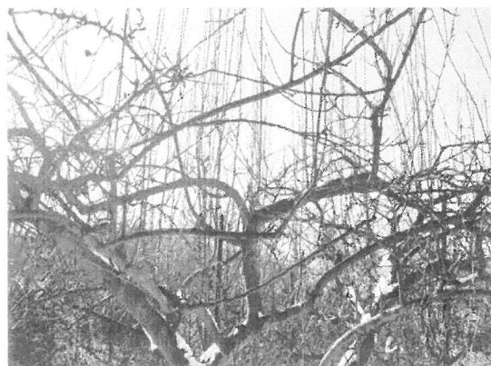
Typický vzhled koruny jabloně po opakovaném řezu v době vegetačního klidu.

přehuštěných a málo přirůstajících korun. Naproti tomu prořezávání za vegetace má za následek menší počet slabších výhonů, které jsou dříve kvetoucí a plodné.