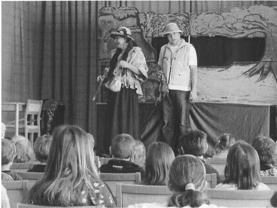
7.3.2011 Přijelo divadlo