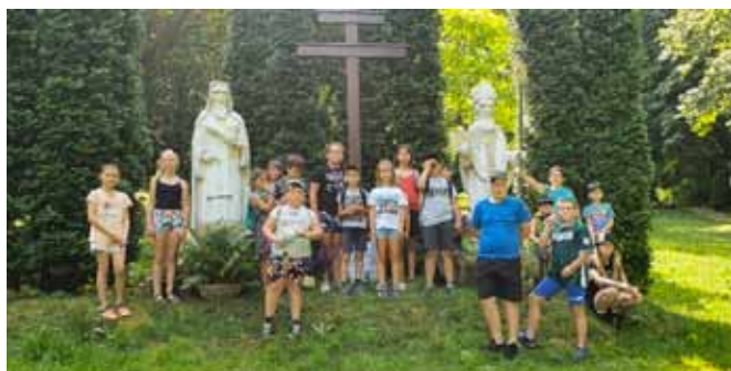
Letní kemp I – Křížová cesta „U svatého“ v Křepicích