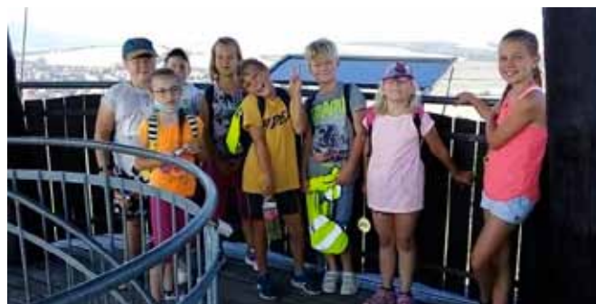
Letní kemp II – Rozhledna v mandloňových sadech v Hustopečích