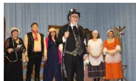
Divadlo Písek do očí